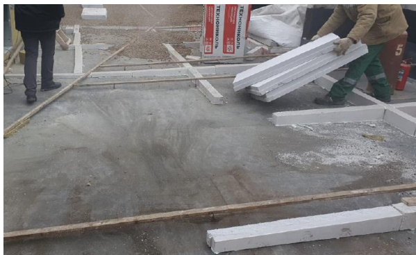
Фото 1 - Монтаж направляющих по заданному уклону

Уклонообразующий слой выполняется из керамзитового гравия по пароизоляционному слою. Для удобства формирования уклона и исключения «мокрых» процессов рекомендуется применять направляющие сформированные из XPS ТЕХНОНИКОЛЬ CARBON , которые укладываются ячейками 1,5 x 1,5 м с учетом уклона и дополнительно фиксируются на клей-пену ТЕХНОНИКОЛЬ 500 PROFESSIONAL универсальный (см.фото 1, 2).