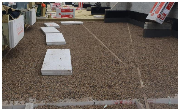
Фото 2 - Засыпка керамзитовым гравием

В качестве пароизоляции по бетонному основанию применяется рулонный пароизоляционный битумосодержащий материал Технобарьер . Технобарьер надежно защищает кровельный пирог от насыщения паром, при этом устойчив к возможным механическим повреждениям в условиях монтажа. Гибкость материала до минус 20 °С делает возможным устройство пароизоляции при отрицательных температурах. Пожарно-технические характеристики кровельного решения представлены в таблице ниже.